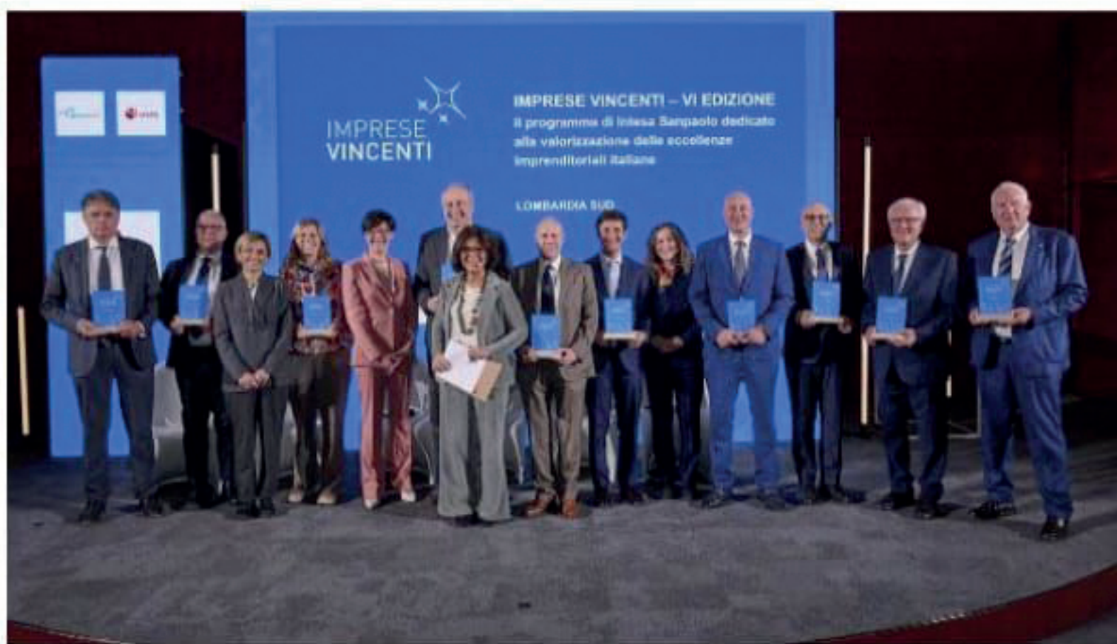
Un'immagine del quarto incontro dei quindici previsti nella nuova edizione di 'Imprese Vincenti'